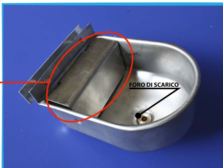
FORO DI SCARICO