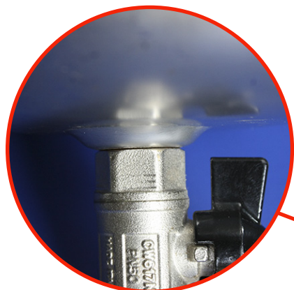
PROFILO A IMBUTO